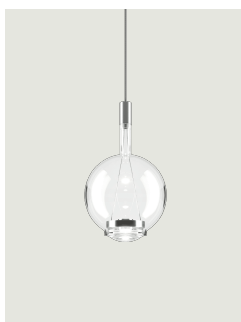
Sky-Fall Round medium