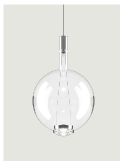
Sky-Fall Round large